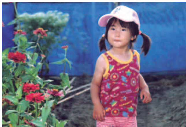
② 上記①画像データを、MS-Word で明るさを調整（図の書式設定－図－イメージコントロールで明るさ 55%程度・コントラスト 60%）