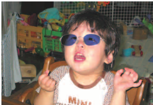
⑤ 上記④の画像データを、MS-Word で明るさを調整（図の書式設定－図－イメージコントロールで明るさ 55%程度・コントラスト 55%）