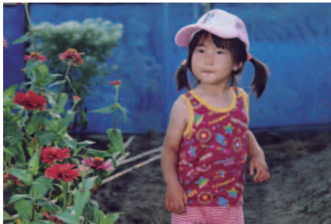
① 写真原稿（カラープリント）を一般的な設定でスキヤニングしたままの画像（エプソン ES8500・ホームモード・カラー400DPIにてスキヤニング）

それ以上の調整を行なうには、画像についての知識を持ったオペレーターが、オフセット印刷用に画像データをコントロール出来るソフトウェアを用いて調整する必要があります。元の画像データの品質により限界はあるものの、このように手間（コスト）をかければ、③⑥のようにかなりの品質改善が可能です。