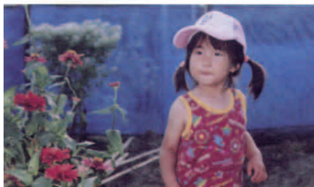
⑩ カラーレーザープリンターの出力紙から画像と文字を一括してスキャン (カラー400dpi・ハイライト部を白にとぼす・ガンマ調整)

それ以上の調整を行なうには、画像についての知をコントロール出来るソフトウェアを用いて調整するものの、このように手間 (コスト) をかければ、③