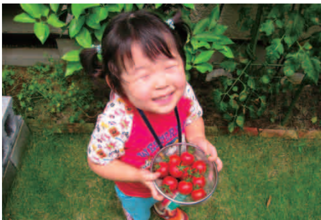
⑧ 解像度が足りている画像 (350dpi・短辺 793×長辺 1167 ピクセル)

※カラー印刷時の画像データの推奨ピクセル数は 印刷レイアウトの辺の長さ (ミリ) ×13.8 ピクセル