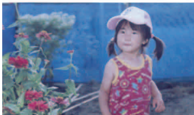
⑨ インクジェットプリンターの出力紙から、画像と文字を一括してスキャン (カラー400dpi・ハイライト部を白にとぼす・ガンマ調整)

それ以上の調整を行なうには、画像についての知をコントロール出来るソフトウェアを用いて調整するものの、このように手間 (コスト) をかければ、③