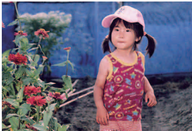
③ 上記①の画像データを AdobePhotoshop にて、オフセット印刷用に調整（ガンマ調整・トーンカーブ調整・アンシャープマスク適用）