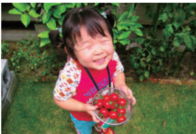
⑦ 解像度が足りない画像 (72DPI・短辺 163×長辺 240 ピクセル)

解像度の不足は、根本的に解決する手段がありません。Web 用データの流用や携帯電話での撮影画像などを使用するときは、特にご注意下さい。また、MS-Word で「図の編集」を実行すると、画面上での表示サイズにピクセル数が間引かれて低解像度の画像になってしまうことがあります。これも注意が必要です。